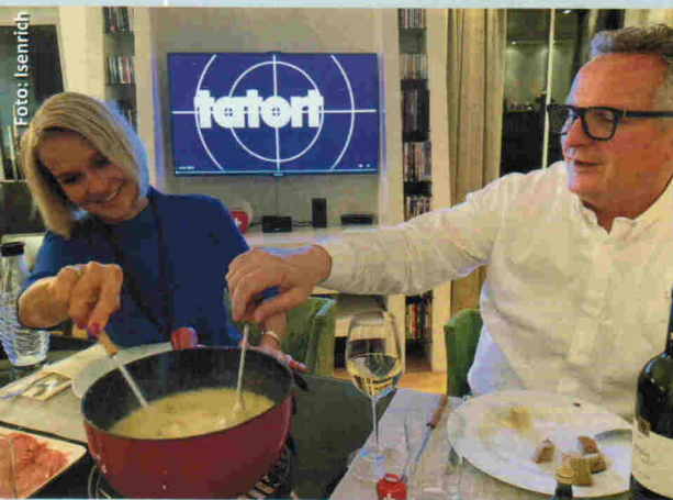
Das Geheimnis des „Achtenrührens“ macht Schweizer Käsefondues perfekt

ab und an einschläfernde Tatort-Krimi ertragen. Jedes dieser Fondues verspricht eine Geschmacks-Explosion und ist bereits fix und fertig zubereitet. Wichtig ist, so sagt Herr Isenrich: „Immer schöne Achten rühren. Isch wohr, ehrlich.“